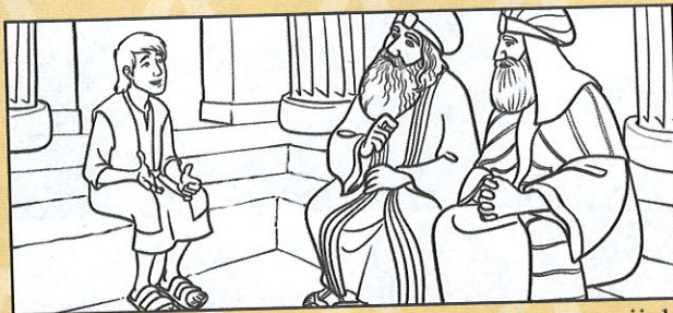
Dwunastoletni Jezus. „Jezus tymczasem rozwijał się umysłowo i fizycznie, Bóg otaczał Go łaskawą opieką, a ludzie życzliwością”. Łukasza 2,52