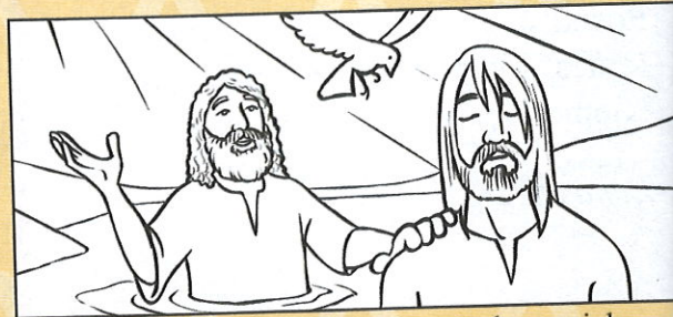
Chrzest Jezusa. „Rozległ się też głos z nieba: Oto mój ukochany Syn, źródło mojej radości”. Mateusza 3,17