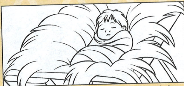
Narodziny Jezusa. „Urodzi ona syna i nadadzą mu imię Emmanuel”. Mateusza 1,23b

Pokoloruj te obrazki, na których jest dorastający Jezus.