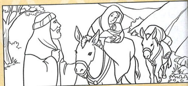
Rodzina Jezusa ucieka do Egiptu z powodu niebezpieczeństwa. Mateusza 2,13